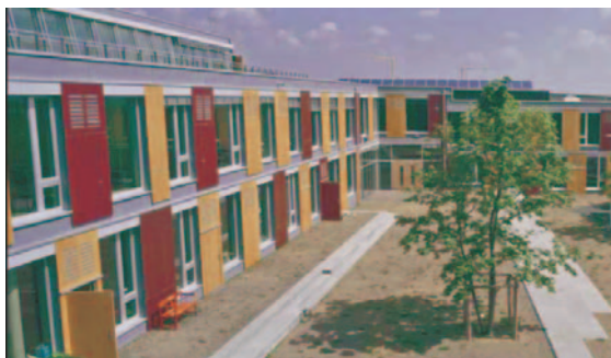
Bild 1 Passivhaus-Schule Frankfurt a. M. (Heizwärmebedarf = 15 \text{ kWh/m}^2\text{a} )

Mindestens sind jedoch die Anforderungen der Energieeinsparverordnung (EnEV 09) um 30 % oder mehr zu unterschreiten. Details sind so zu planen, dass der Aufschlag für Wärmebrücken kleiner oder gleich 0,03 \text{ W/m}^2\text{K} ist. Dabei ist entweder ein Einzelnachweis oder Details aus dem Wärmebrückenkatalog zulässig. Die Dichtigkeit ist grundsätzlich mit dem Blower-Door Test nachzuweisen. Dabei ist ein n_{50} -Wert von kleiner als 0,6 \text{ 1/h} zu erreichen und die Beschränkung auf repräsentative Teilbereiche des Gebäudes denkbar.