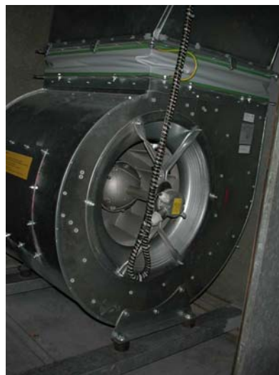
Bild 3 Hocheffizienter Ventilator

Kühlung und Befeuchtung sind grundsätzlich nicht zulässig, zunächst sind alle baulichen Möglichkeiten auszuschöpfen (Ausnahme: konservatorische oder medizinische Gründe).