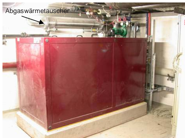
Bild 2 Blockheizkraftwerk mit Abgaswärmetauschen Altenpflegeheim Stuttgart

Es sind möglichst Systeme einzusetzen, die Abwärme aus Kraft-Wärme-Kopplung nutzen oder die auf erneuerbaren Energien basieren. Ist dies nicht möglich oder wirtschaftlich vertretbar, wird der Einsatz von Erdgas bevorzugt.